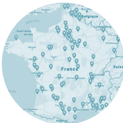
Carte des 128 associations partenaires de l'opération Femme en Fête 2017

Dons Solidaires peut compter sur son large réseau d'associations caritatives partenaires pour que les femmes en difficulté reçoivent des produits partout en France. Ces produits, provenant des dons d'entreprises, ont été préparés par lots et proposés à nos associations via l'e-catalogue. Les commandes ont ensuite été livrées dans les différentes structures.