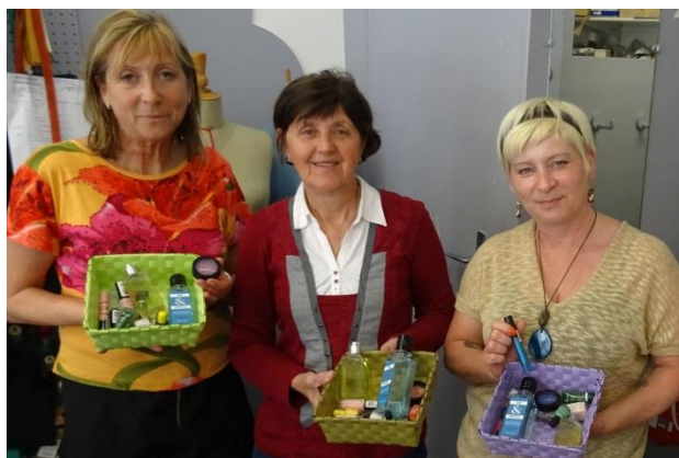
Association Vestali, Lievin (62)