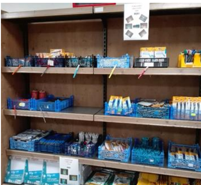
Epicerie sociale l'hirondelle, Le Creusot (71)

Bénéficiaires de l'association Le Tremplin, Moulin (03)