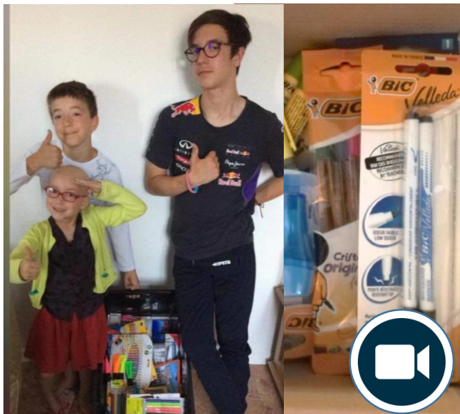
Association Elise Princesse Courageuse, Montmorency (95)

« Maintenant je peux me tromper et corriger l'exercice » témoigne un bénéficiaire de nationalité colombienne. CADA, Groupe SOS Solidarités, Dax (40)