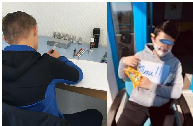
Apprentis d'Auteuil, La Côte Saint André (38)

Pendant le confinement, 146 associations ont pu bénéficier de fournitures scolaires, jeux et matériel pour permettre aux enfants et à leurs familles de traverser ce moment difficile.