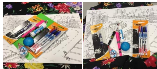
Association Verdun Chantier, Verdun (55)

Bénéficiaires de l'association Pain de Vie Réalmont (81)