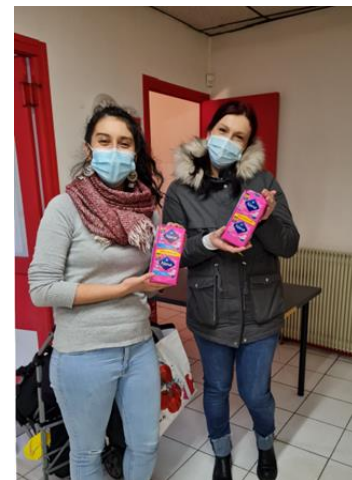
ADATE, Grenoble (38)

Responsable Alerte Solidarité à Irigny (69)