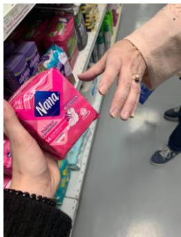
Association Jeunesse et Vie (27)