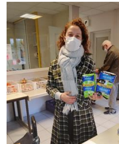
Bénéficiaires d'Imagine 84, Avignon

« C'est un produit qui n'est pas souvent réclamé car un peu tabou, mais lorsqu'on en propose aux bénéficiaires, c'est évident qu'il est très demandé. Les produits hygiéniques reçus sont de très bonne qualité et les bénéficiaires en sont vraiment ravies ! »