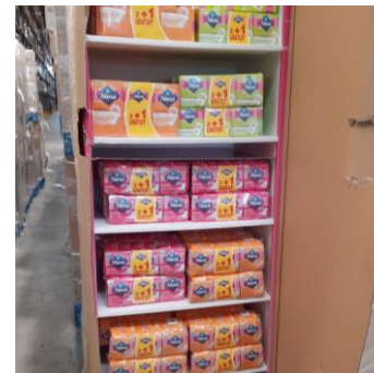
Réception de palettes de protections hygiéniques à l'entrepôt Dons Solidaires