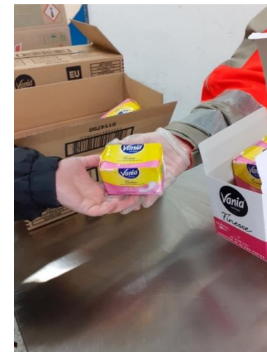
Croix Rouge Française Caux Vallée de la Seine (76)