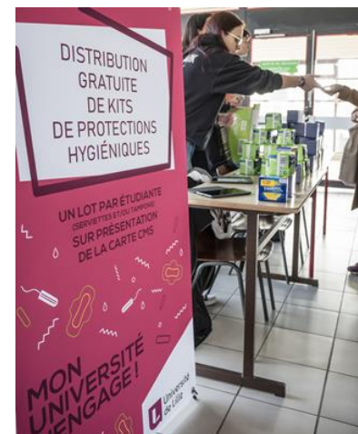
Distribution à l'Université de Lille, (59)

Bénévole de l'association A Votre Service (93)