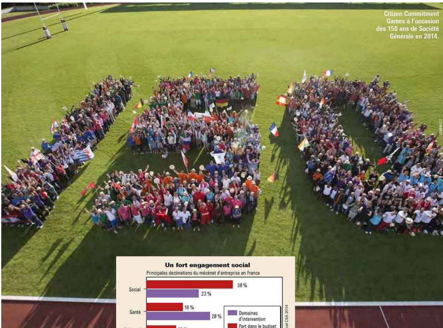
Citizen Commitment Games à l'occasion des 150 ans de Société Générale en 2014.